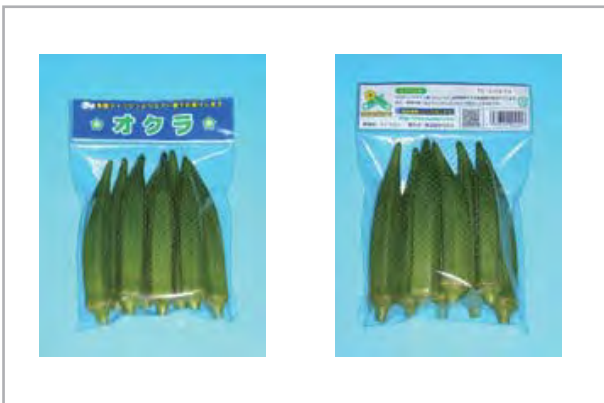
< 商品例 >

マニラ事務所: 2-D Bldg#2, Salem International Commercial Complex, Domestic Road, Pasay City TEL/FAX: +63-2-854-8564