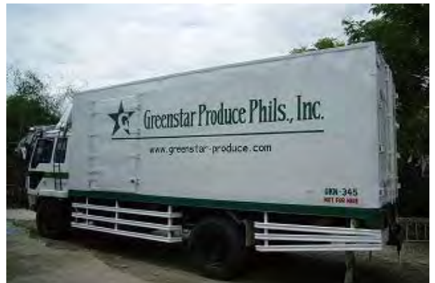
< 空港輸送に使用する冷蔵トラック >