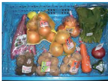
道内外向けの商品例