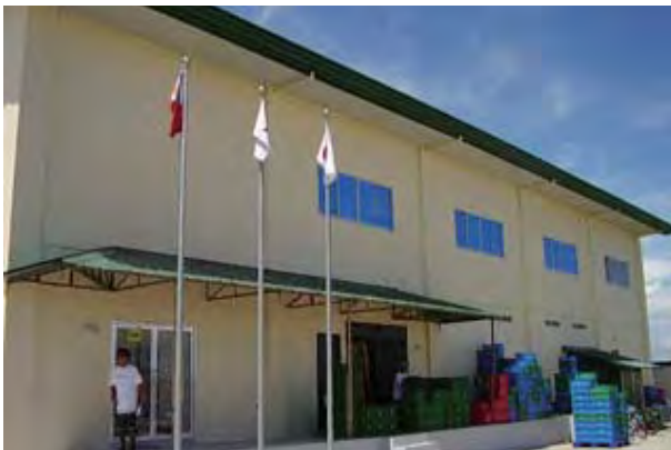
< 新工場 >

そのため、オクラの主産地であるタルラック州のラパス地区に衛生的で近代的な新しい施設 (パッキング場) を建設致しました。