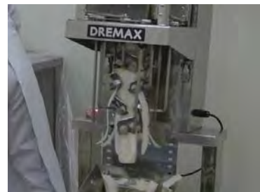
大根つまの加工例