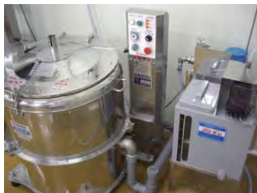
洗浄済野菜の脱水設備