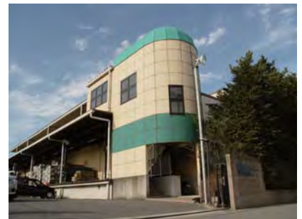
< 成田流通センター >

様々なニーズに応えられるよう、ソフト面とハード面を充実させた最新設備で、スライサー等のカット設備を用いて多様な、そして安全な商品作りを目指します。